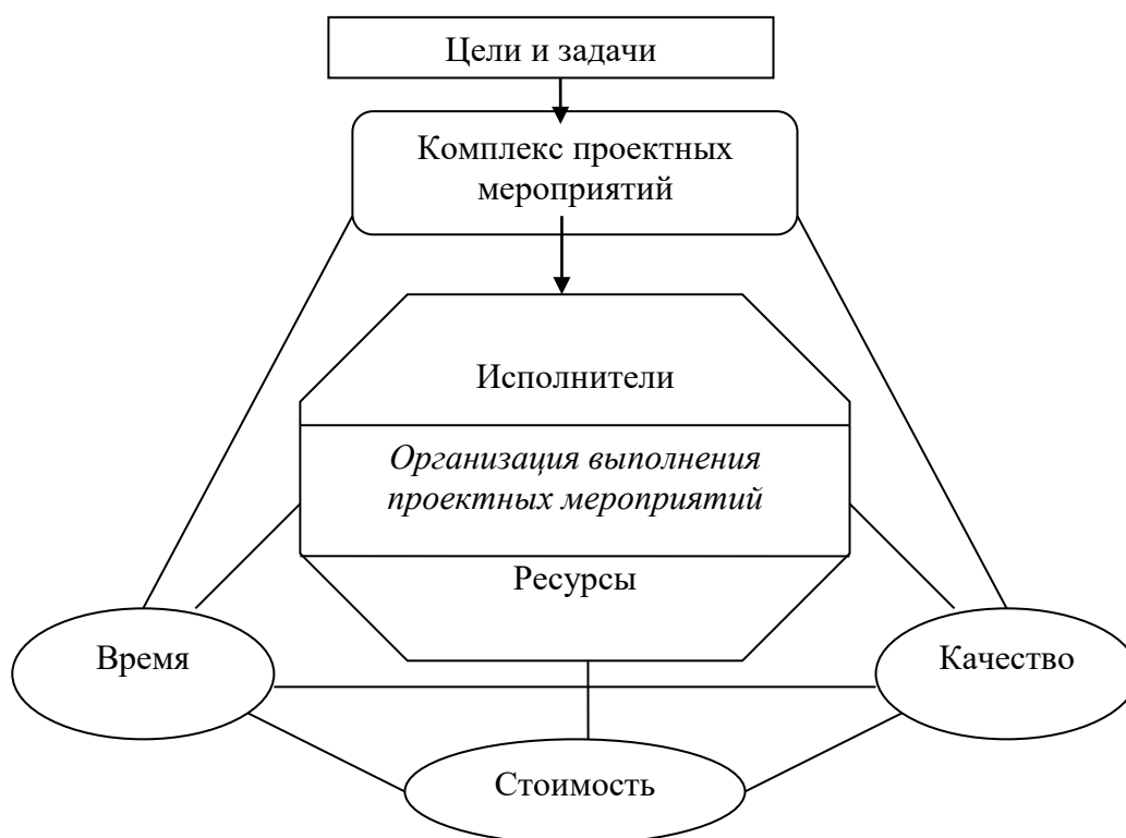
Рис. 1. Основные элементы (характеристики) инновационного проекта

разделов) программы, так и отдельно, решая конкретную проблему на приоритетных направлениях развития науки и техники.